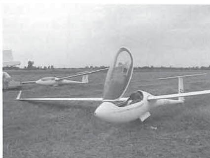
De spanning is te snijden