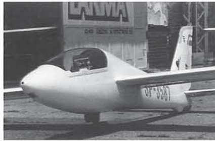
MDM, opvolger van de Swift

Op de WK-openingsdag in Leszno kregen we een demonstratie te zien van de "Solo Fox", de éénzitsversie van de bekende kunstvluchttweezitter. Dit toestel heeft blijkbaar in 2001 zijn eerste vluchten gemaakt. Het