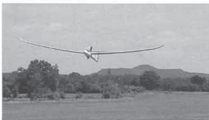
Start van Walter Geenen met zijn Ventus 2 CM

Coninck voor de Standaard en in de Open/Ren werd het een echte thriller met slechts 15,4 punten verschil tussen de 1ste en de 4de plaats, maar het was Walter Geenen die aan het langste eind trok.