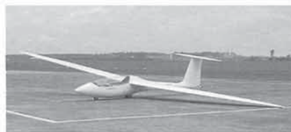
P1, een braziliaan

Op het forum van de LVZC vonden we een link naar een vrij nieuw Braziliaans tweezitstoestel, de P1. Het is een glasvezeltoestel volgens JAR 22, waarvan het heel origineel ontwerp ontstond in 1995. De eerste vlucht van het prototype geschiedde op 3 maart 2002. Het vertoont goede vlieg-eigenschappen, hoge rolsnelheid, goedig overtrekgedrag. Meer dan 60 potentiële kopers hebben hun interesse betoond voor dit toestel.