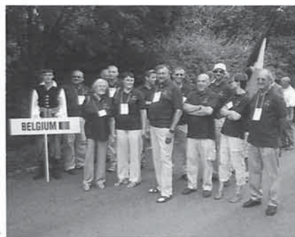
De belgische afvaardiging

Op de eerste Team Captains' briefing worden heel wat detailkwesties besproken i.v.m. reglementen, procedures, documenten, enz. Een regelmatig terugkerend veiligheidsknelpunt is de startprocedure, waarbij de vlieger tegelijkertijd zijn positie t.o.v. de startlijn, zijn hoogte en zijn snelheid moet in het oog houden. In de praktijk betekent dat, dat men rakelings langs en parallel vliegt met