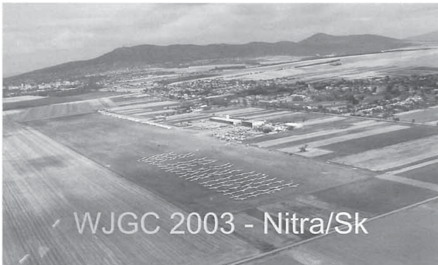
Nitra vanuit de lucht

Achteraf bekeken, bleek de dag evenwel perfect vliegbaar. Zij het met enige moeilijke pas-