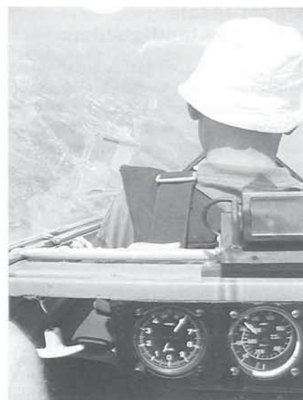
Look out verzorgen

Vraag de documenten tijdig aan a.u.b. en wacht niet met de inspectie tot bij de aanvang van het nieuwe seizoen! De controleurs vliegen ook graag vanaf maart!!