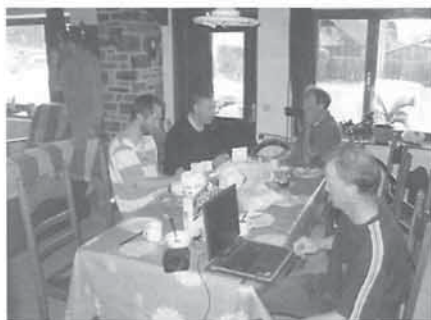
De vlaamse deelnemers bij het ontbijt

Florennes. Dit was reeds 40 km omgevlogen en onmogelijk St. Hubert te bereiken. Ik ben terug zuidelijk gevlogen en zag een kleine opening waar het niet regende. Ik gaf mij een kleine kans en had mijn limiet gezet zodanig dat ik nog net terug buiten het onweer kon terugkeren. Eerst 5 tot 6 meter zakken en plots in de regen stompden van plus 5 meter. Ik heb hier dan de basis genomen en had dan 400 m extra op MC 3 om in St. Hubert binnen te komen. In volle regen ben ik dan geland. Ik ben nog een twintigtal minuten blijven zitten tot de regen verminderde. Tijdens mijn wachten zag ik een zwever zeer laag op de horizon zijn finale doen en ineens verdwijnen. Naderhand bleek het Marc te zijn die te laag finishte en in de vallei van St. Hubert landde. Hij kreeg