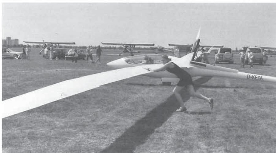
Het vertrek van de ETA, duwen a.u.b.