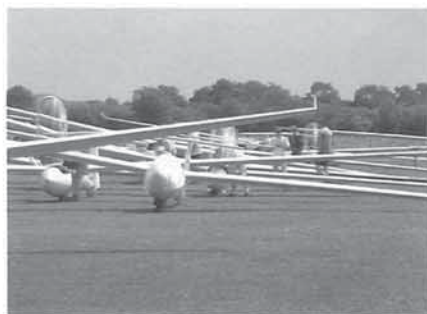
Klaar om te vertrekken