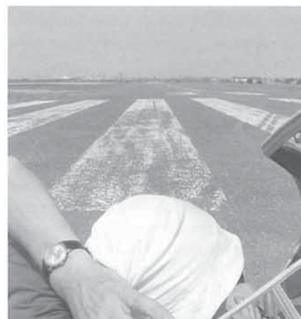
Waar is de sleper?