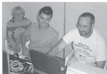
De team captain bij zijn dagelijks werk

Terwijl de voorlopige resultaten al snel op de computerschermen verschijnen, beginnen velen aan het afbreken van tenten, wegrollen van caravans, finale poetsbeurt van de toestellen, enkele aanhangwagens vertrekken al huiswaarts. De sfeer is een beetje surrealistisch, en mengeling van spanning, opgeluchtheid, heimwee... Op het afscheidsfeest geven de Finnen een rockrecital ten beste!